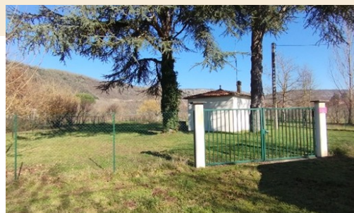
Captage Rue Condamines

Et plusieurs autres petits tronçons soumis aux fuites.